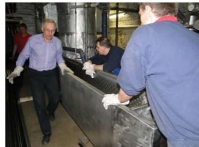
© Rosa Toifl & Co GmbH