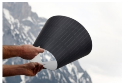
© Sunplugged – Solare Energiesysteme GmbH

Maßnahmen im Energie- und Umweltbereich: